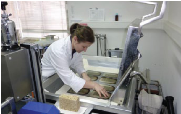
Die Blätter eines Aschebuches werden in einem Wasserbad von Schadstoffen befreit.