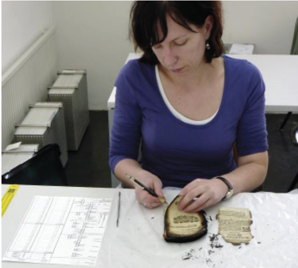
Der Zustand eines eingelieferten Aschebuchs wird exakt erfasst.