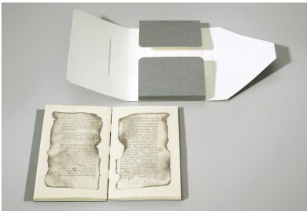
Ein restauriertes Aschebuch wurde so geheftet, dass es ohne Schaden zu nehmen, digitalisiert werden kann.

überliefert, mit alkalischem Leim stabilisiert und somit vor Rissen geschützt. Jetzt können sie zwischen Industriefilz gelegt und in mehreren Schritten getrocknet werden. Dabei müssen gewisse Hilfsmaterialien, die den geschilderten Prozess ermöglichten, wieder ausgeschieden werden. Zuletzt werden die Blätter deckungsgleich zusammengelegt, gefalzt und zusammengesteckt. Allenfalls noch vorhandene Ablagerungen von Ascheresten werden entfernt und die restaurierten Buchblöcke nach den Vorgaben der Anna Amalia Bibliothek in Konservierungseinbände eingebunden. Die Hefttechnik und die gewählten Materialien erlauben es, die Bände so zu öffnen, dass sie ohne Schaden digitalisiert werden können. In maßgefertigten Schutzbehältern werden schließlich die geretteten Aschebücher an die inzwischen wieder aufgebaute beziehungsweise renovierte Bibliothek in Weimar geliefert.