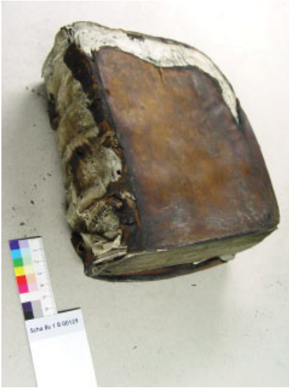
Beispiel eines beschädigten Einbands vor der Restaurierung