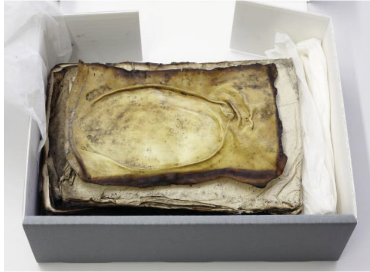
Aschebuch in der Verpackung aus Weimar vor der Restaurierung