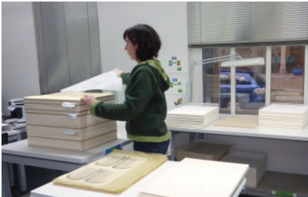
Nach dem komplexen Prozess zur Reinigung und Stabilisierung der Blätter werden sie in mehreren Schritten getrocknet.